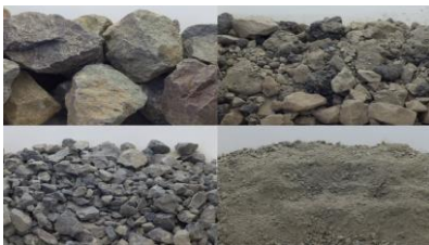
砕石の種類、用途例