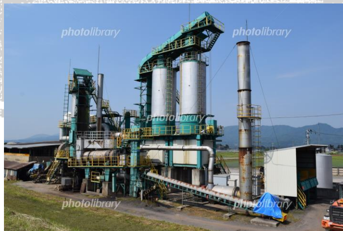
アスファルト合材プラント例